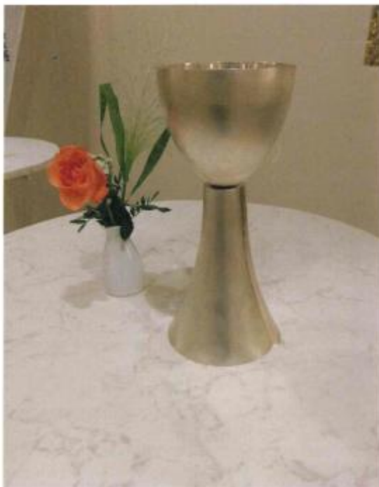
Abendmahlskelch Erlöserkirche, 2019